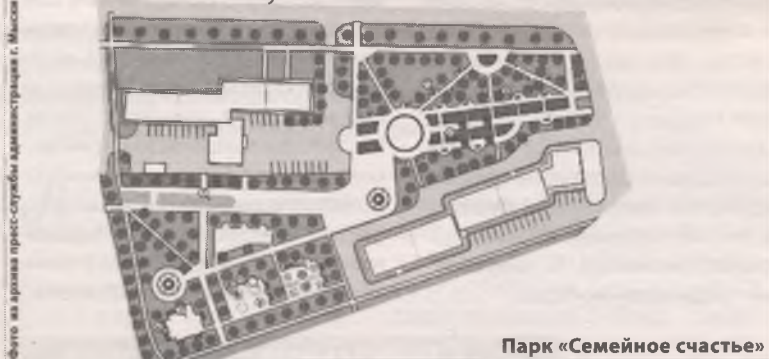
Фото на аэроплане пресс-служба администрации г. Мыска